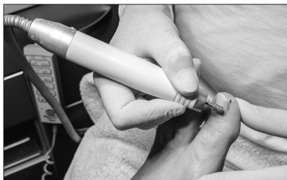
Schmerzfreie Behandlung mit kühlender „Nasstechnik“

dernsten Fußpflegegeräte, die derzeit auf dem Markt sind.